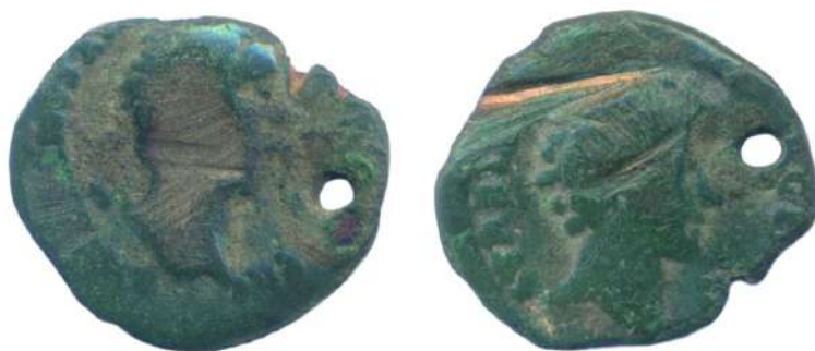
Fig. 2. Moneda descoperită în necropola de la Dumitreștii Gălății (mărită)