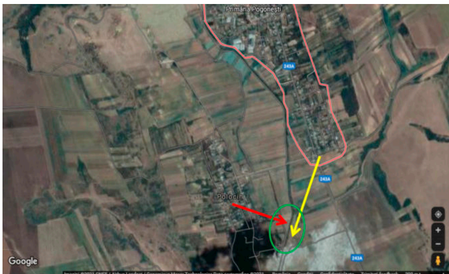
Fig. 1. Localizarea necropolelor de la Polocin (stânga) și Pogonești (dreapta)

Primele două necropole sunt situate pe teritoriul județului Vaslui, în aria comunei Pogonești, pe malul râului Tutova. Sunt două necropole foarte apropiate una de cealaltă, situate pe cele două maluri ale Tutovei. Cea mai mare dintre