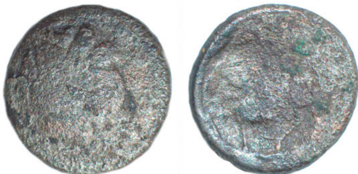
Fig. 2. Moneda de tip „Adâncata-Mănăstirea” descoperită în situl de la Letea Veche (mărită) Fig. 2. Coin of the “Adâncata-Mănăstirea” type discovered in the site of Letea Veche (enlarged)

Cerneahov, este posibil ca acesta să provină dintr-o așezare învecinată, din această perioadă. Probabil că în urma lucrărilor agricole, ea a fost purtată în situl getic.