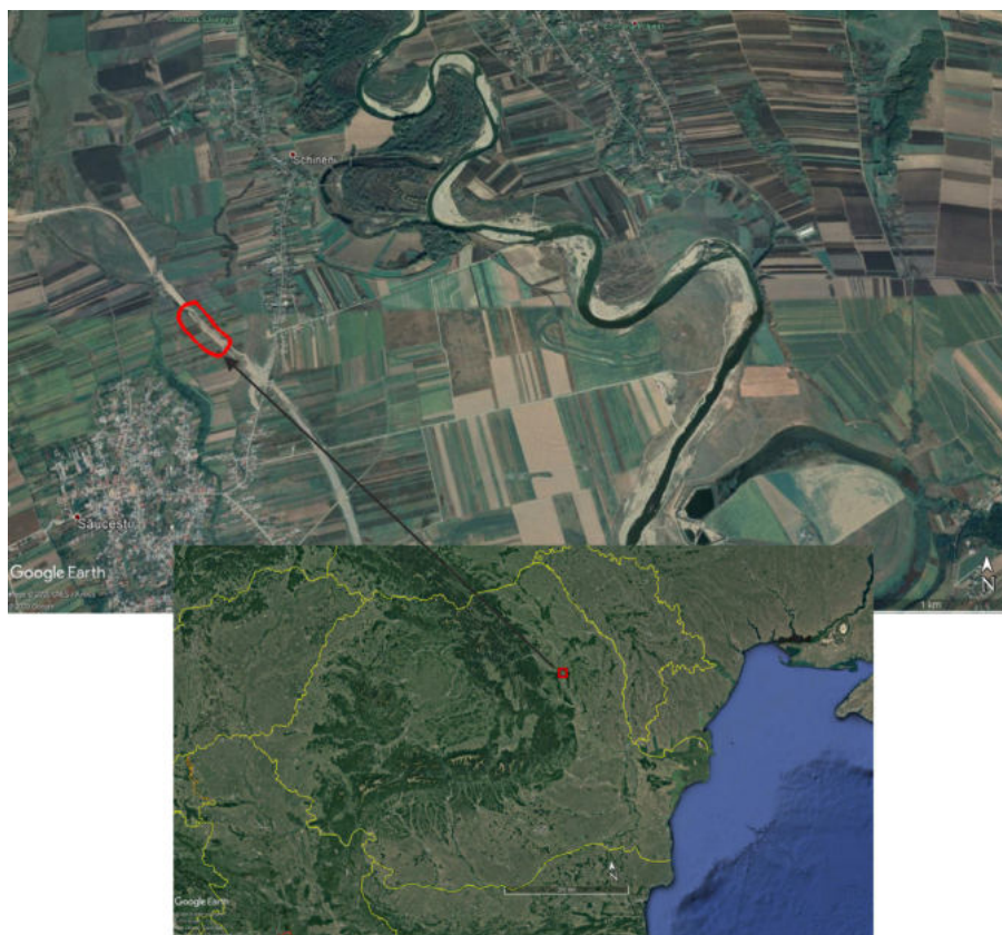
Pl. 1. Localizarea sitului nr. 2 cercetat pe Varianta Ocolitoare a municipiului Bacău Pl. 1. Location of site no. 2 investigated on the highway of Bacău County