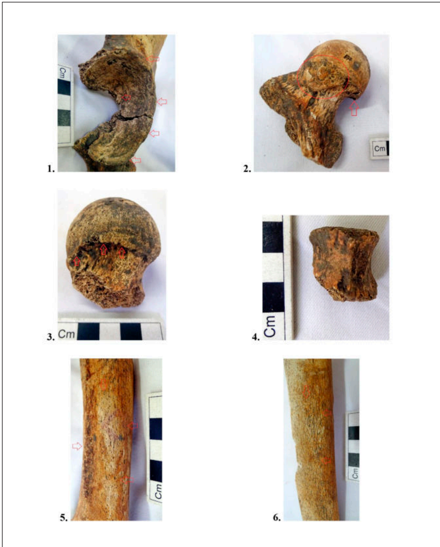
Pl. 4. 1. Coxal, acetabulum, coxartroză, „lipping”; 2. Femur drept, epifiza proximală, placă, „lipping”; 3. Cap femural, „lipping”; 4. Vertebră de mamifer; 5. Femur, diafiză, linea aspera rugoasă, reacție periosteală activă, pigmențatie tafonomică; 6. Tibie, diafiză, reacție periosteală inactivă

Pl. 4. 1. Coxal, acetabulum, coxarthrosis, “lipping”; 2. Right femur, proximal epiphysis, plaque, “lipping”; 3. Femoral head, “lipping”; 4. Mammalian vertebra; 5. Femur, diaphysis, rough linea aspera , active periosteal reaction, taphonomic pigmentation; 6. Tibia, diaphysis, inactive periosteal reaction