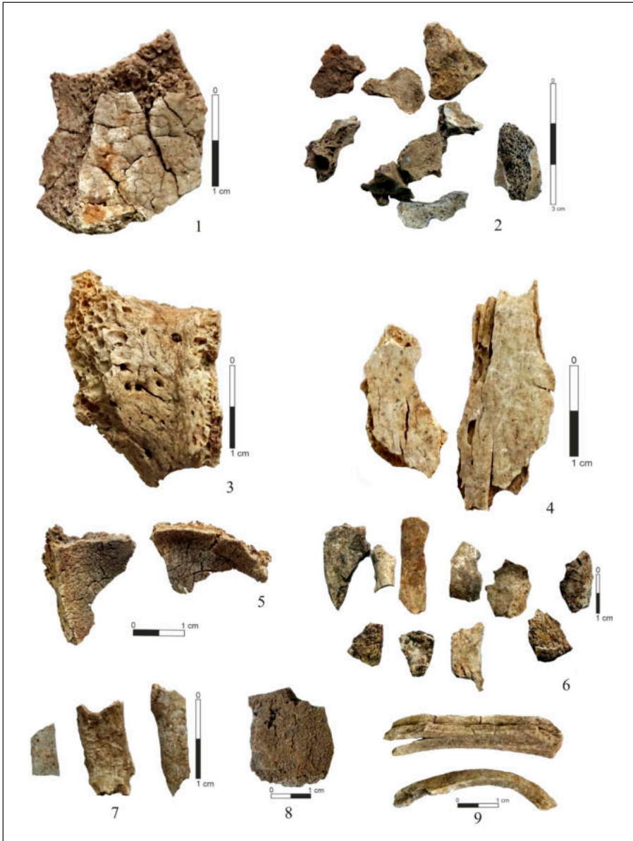
Pl. 4. Resturi osteologice. 1. Fragment din neurocraniu, fisuri reticulare; 2. Resturi craniene; 3. Parte dintr-un corp vertebral lombar; 4. Fragmente din coaste; 5. Suprafețe de articulație, fisuri reticulare; 6. Fragmente din diafizele oaselor membrelor; 7. Fragmente din falange; 8. Mamifer de talie mare, fragment cranian; 9. Mamifer de talie mare, fragmente din diafize Pl. 4. Osteological remains. 1. Fragment of neurocranium, reticular fissures; 2. Cranial remains; 3. Part of a lumbar vertebral body; 4. Ribs fragments; 5. Joint surfaces, reticular cracks; 6. Limb bones, fragments of the diaphyses; 7. Fragments of phalanges; 8. Large mammal, cranial fragment; 9. Large mammal, fragments of diaphyses