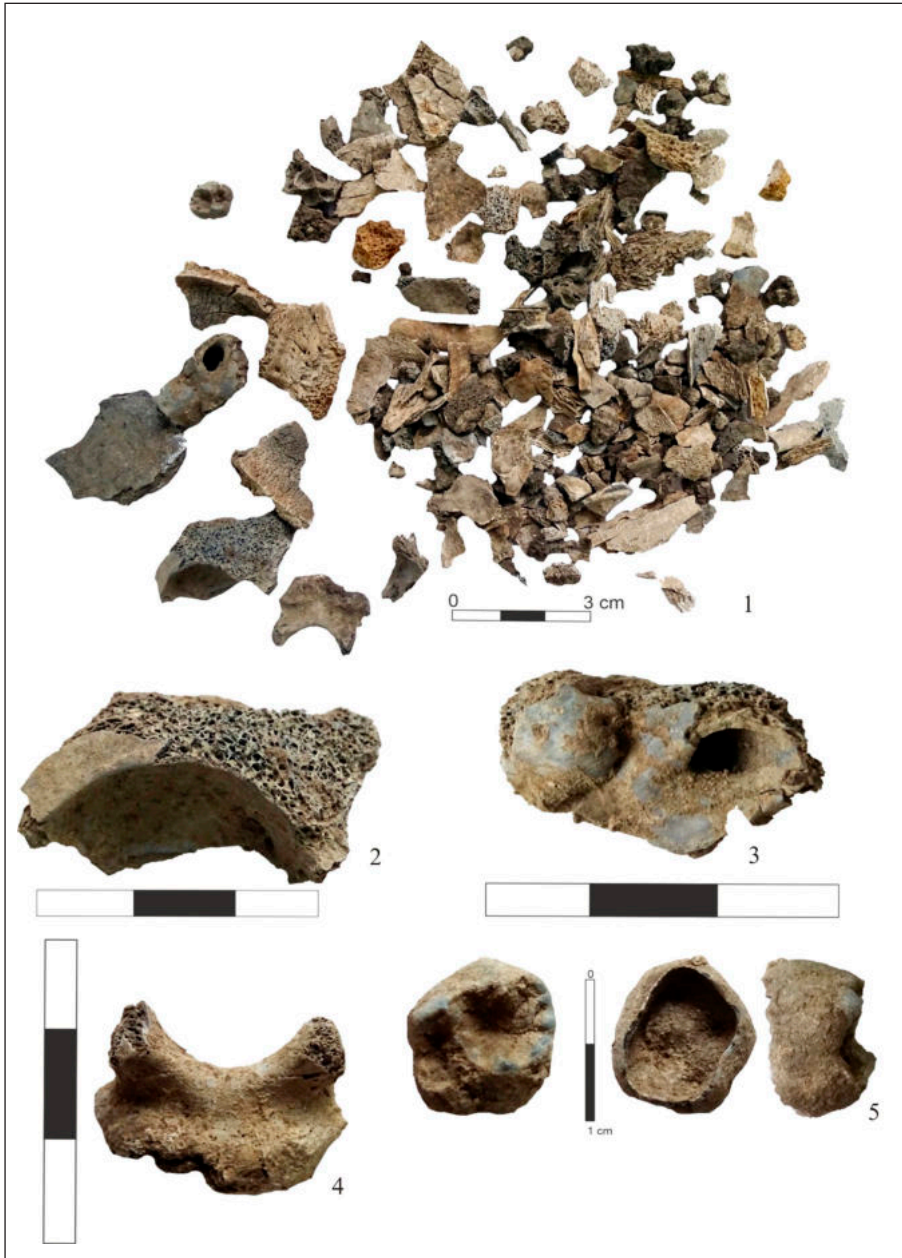
Pl. 3. Resturi osteologice. 1. Parte din proba osteologică după curățare; 2. Frontal, parte din orbita de pe partea stângă; 3. Temporal, pars petrosa ; 4. Pars basilaris ; 5. Coroana unui molar secundar definitiv Pl. 3. Osteological remains. 1. Part of the osteological sample after cleaning; 2. Frontal, part of the left orbital roof; 3. Temporal, pars petrosa ; 4. Pars basilaris ; 5. The crown of a permanent secondary molar