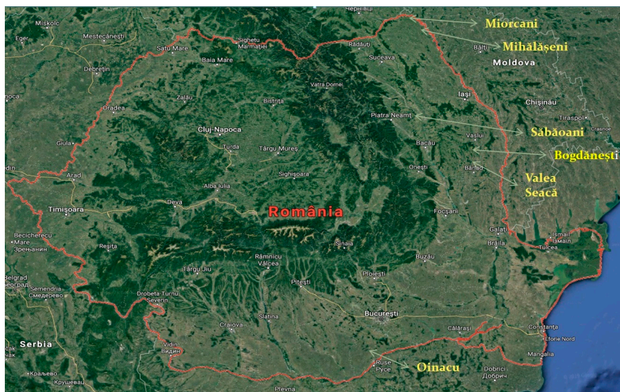
Fig. 1. Repere geografice ( https://www.google.com/maps/place/România/ ) Fig. 1. Geographic landmarks ( https://www.google.com/maps/place/România/ )

se înscrie în intervalul 20-30 ani, ceea ce înseamnă că femeile arareori depășeau pragul de 30 ani. Autorii subliniază cauzele acestui fenomen: igiena precară, riscurile din timpul parturirii, infecțiile post partum . Populația de la Valea Seacă poate fi, în medie, caracterizată astfel: statură supramijlocie, calotă dolico crană la bărbați și mezocrană la femei, hipsicranie la ambele sexe, acrocranie la bărbați și metricocranie la femei, frunte eurimetopă, neurocraniu oval, față mezenă, orbite mezoconci, nas mezin sau camerin la ambele sexe. Din punct de vedere tipologic, acest segment populațional aparține tipului europoid. Un singur craniu feminin prezintă caractere mongoloide pe un fond alpinoido-mediteranoid. În general, populația este polimorfă. Predomină elementele mediteranoide și protoeuropoide atenuate (prin brahicefalizare), în asociere cu cele nordoide, în special la bărbați. Autorii subliniază că nu au identificat în seria scheletică analizată nici un caz de deformare craniană artificială (intenționată) specifică populațiilor sarmatice sau gotice. Predominanța elementelor mediteranoide atestă originea autohtonă a acestui grup, iar prezența elementelor nordoide și proto-europoide, chiar dacă într-o pondere mai scăzută, dovedește întrucâtva spargerea arealului locuit de acest segment populațional (Botezatu et alii 1983).